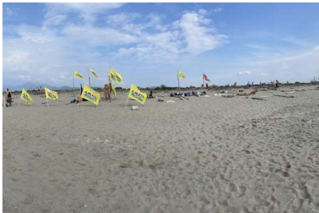
Spiaggia della Lecciona Lucca